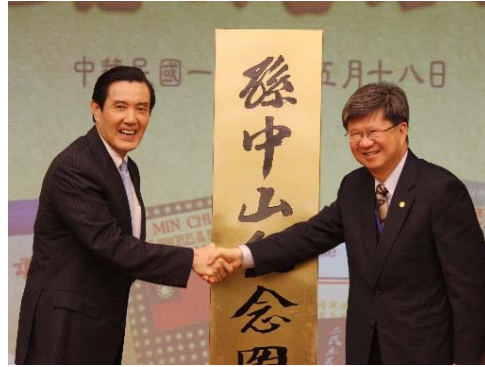
102 孫中山紀念圖書館 揭幕與啟用儀式